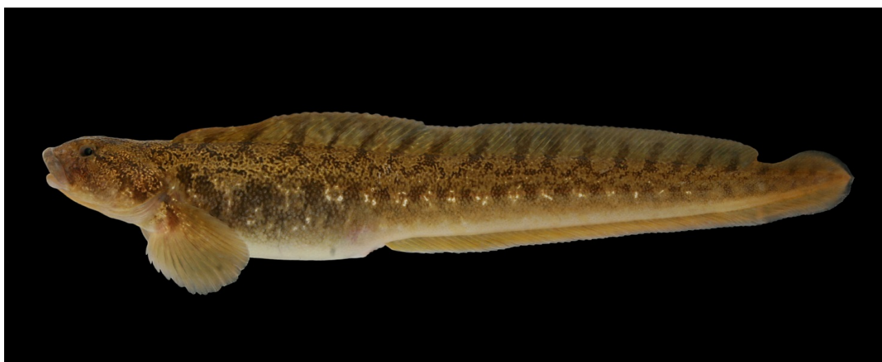
Ålekvabbe fra munden af Ribe Vesterå, 29. oktober 2009.

Projektet er finansieret af Aage V. Jensen Naturfond