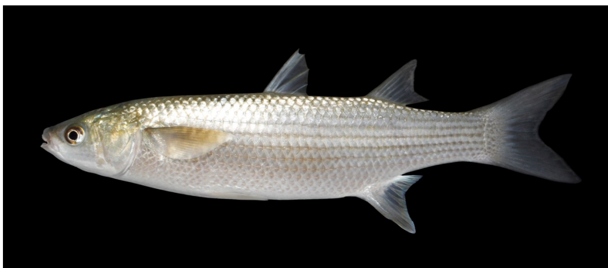
Tyklæbet mulde på 34 cm fra Alcudia, Mallorca, 10. juli 2015.

Projektet er finansieret af Aage V. Jensen Naturfond