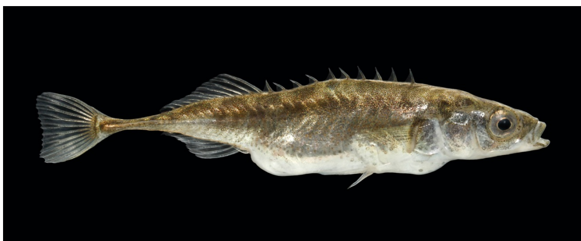
Nipigget hundestejle på 5,1 cm fra Hov Havn, 15. juli 2012.

Projektet er finansieret af Aage V. Jensen Naturfond