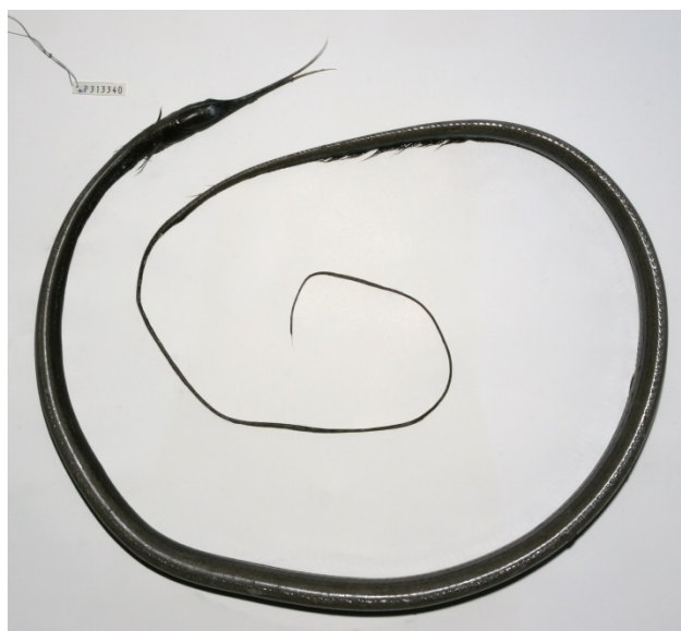
Langhalet sneppeål fra Grønland, 2007.

Projektet er finansieret af Aage V. Jensen Naturfond