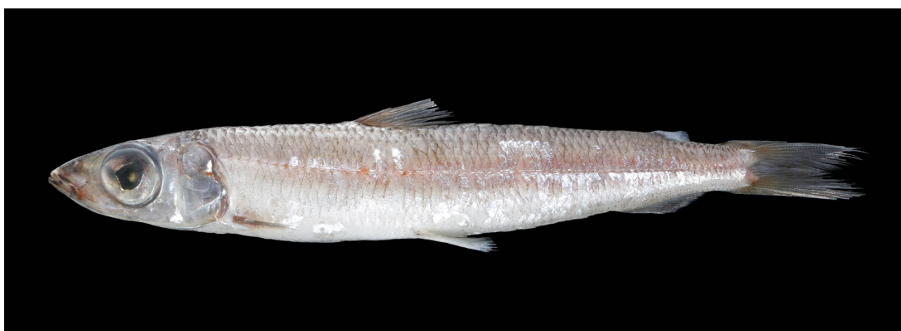
Guldlaks på 32,5 cm fra Norskehavet den 13. maj 2017.

Projektet er finansieret af Aage V. Jensen Naturfond