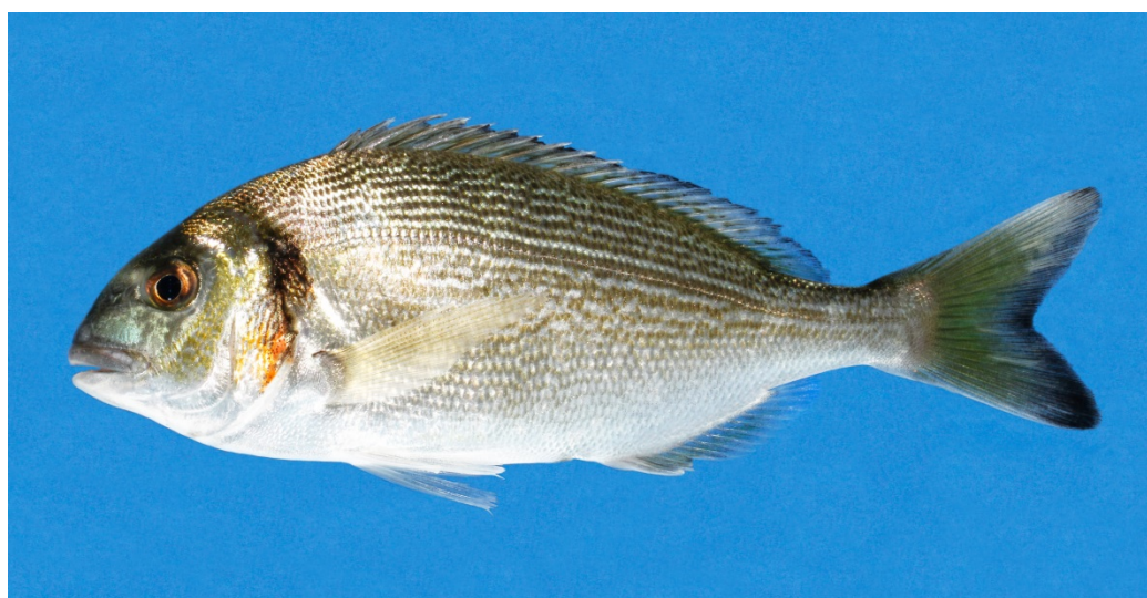
Guldbrasen fra Mosedede i Køge Bugt, 2. oktober 2014.

Projektet er finansieret af Aage V. Jensen Naturfond