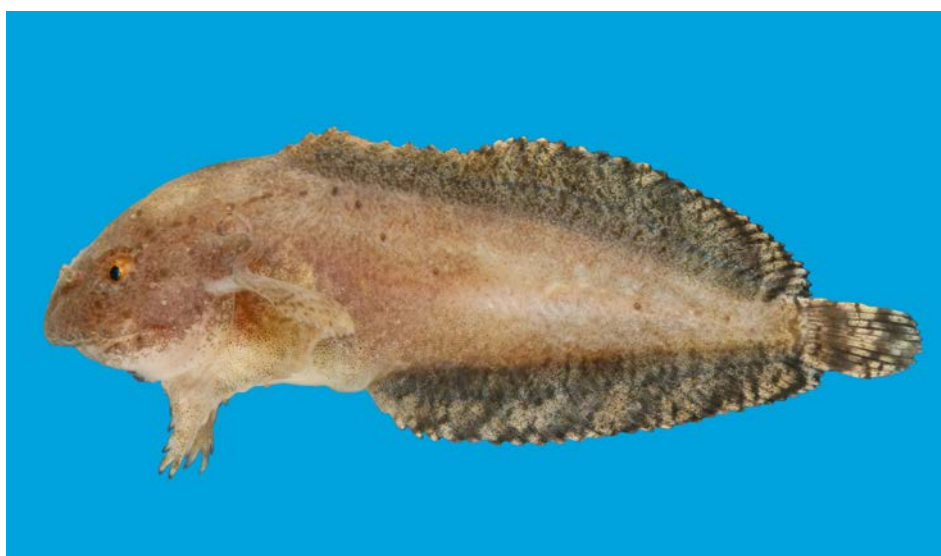
Finnebræmmet ringbug fra Nordsøen, 22. november 2013.

Projektet er finansieret af Aage V. Jensen Naturfond