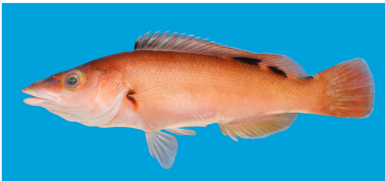
Rødnæb på 19,0 cm fra Måløy, Norge, august 2017.