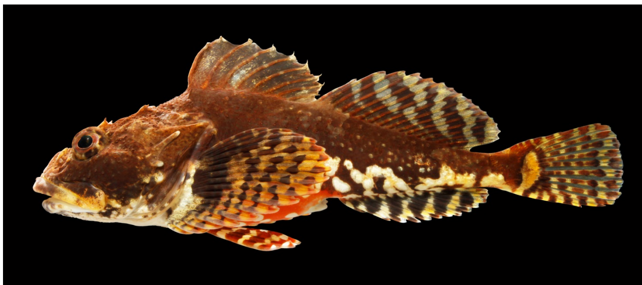
Han-ulk på 19,5 cm fra Skovshoved Havn, 1. april 2012.

Projektet er finansieret af Aage V. Jensen Naturfond