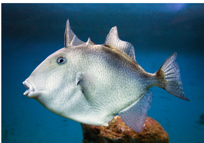
Aftrækkerfisk fra akvarium i Kroatien, 2017.

Projektet er finansieret af Aage V. Jensen Naturfond